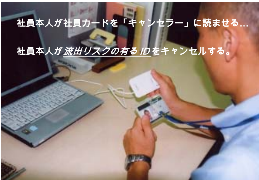
社員本人が社員カードを「キャンセラー」に読ませる...