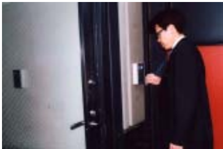
社員カードをドアの読み取り器にかざす...