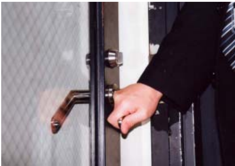
ドアが開いて...同僚と朝の挨拶を交わす、よそ者は入れないところ...